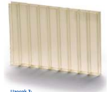
Uzorak 3: \Delta Y_i = 10 - Uobičajena garancija za višeslojne polikarbonatske ploče