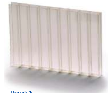
Uzorak 2: \Delta Y_i = 2 - Lexan Thermoclear Plus ploče garantuju