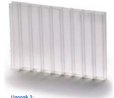
Uzorak 1: \Delta Y_i = 0 - Referentni uzorak

Molimo Vas da za više detalja konsultujete GE Plastics Specialty Film & Sheet Service Centre ili lokalnog distributera.